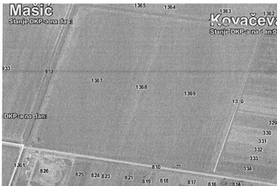
Slika 2. Lokacija RCGO „Šagulje“

Brodsko posavska županija je temeljem Zakona o otpadu (N.N.br.178/04; 111/06; 60/08 i 87/09 ) donijela županijski Plan gospodarenja otpadom, te je za lokaciju budućeg Centra za gospodarenje otpadom odredilo lokaciju „Šagulje“ na području grada Nove Gradiške u k.o. Kovačevac na kčbr.1367 na površini 128.254 m 2 i kčbr.1369 na površini 140.455 m 2 . ( Slika.2.). Navedene čestice su u vlasništvu Republike Hrvatske. Ova lokacija potvrđena je spomenutom Studijom predizvodljivosti kao najprihvatljivija i najbolja i za regionalni centar za gospodarenje otpadom.